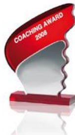
Coaching Award 2008